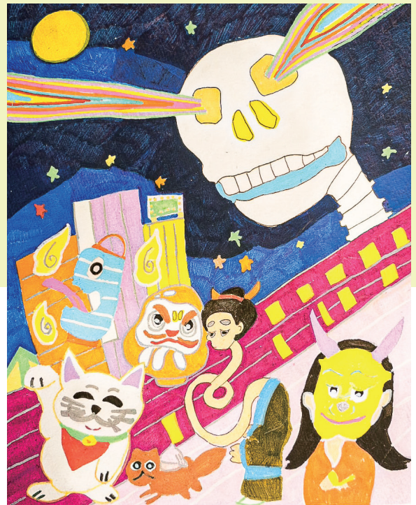
ようかいパレード

まあくてやわらかくてモフモフでかわいいものが大好きな優メン。パステルカラーを基調とした魅力的な配色『ともやカラー』でポップな世界観を創り上げている。次はどんな朝矢カラーを見せてくれるのだろうか。そうワクワクさせてくれるアーティスト。