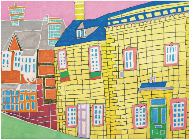
こんな町に住みたい