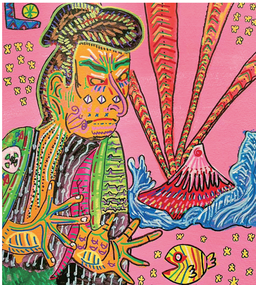
浮世絵 | 西原 宏紀