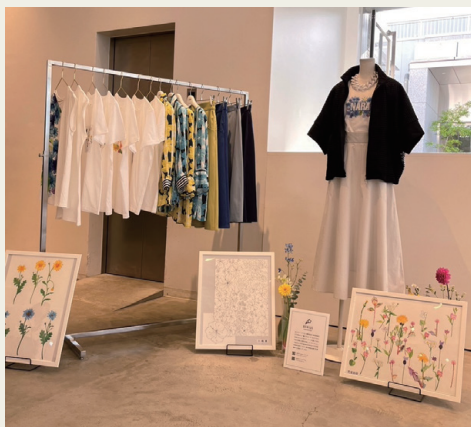
ジーニアス作品を使用した展示スペース。

ジーニアス作品を使用したお洋服は特別な展示スペースが用意され、実際に起用されたアート作品の原画なども展示されました。当日ご来場いただいた百貨店関係者様など、多くのお客様にご覧いただきジーニアスの活動を知っていただける機会となりました。