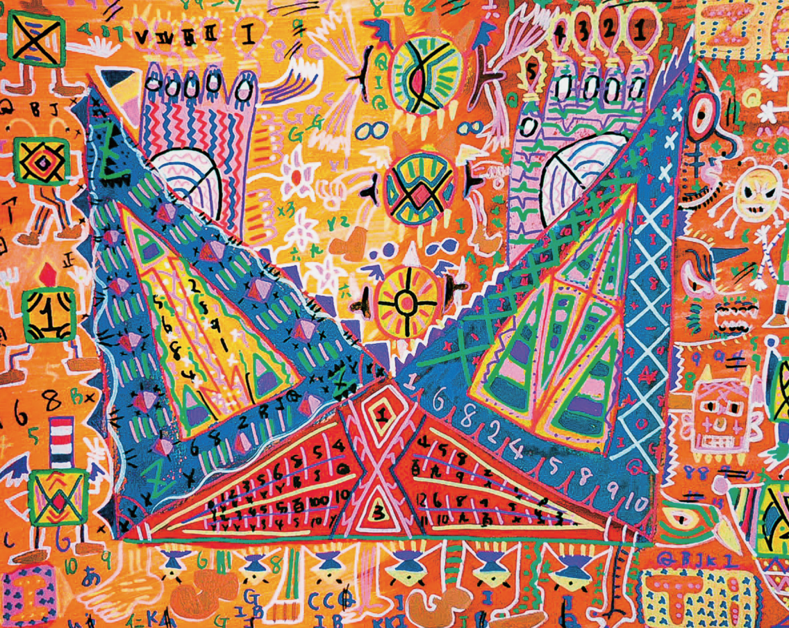
prayer | 西原宏紀