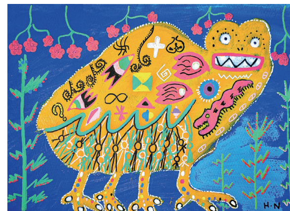
テンペスト | 西原宏紀

「特性」は「環境」次第で「才能」に転換できることを 私たちジーニアスは証明していきます。