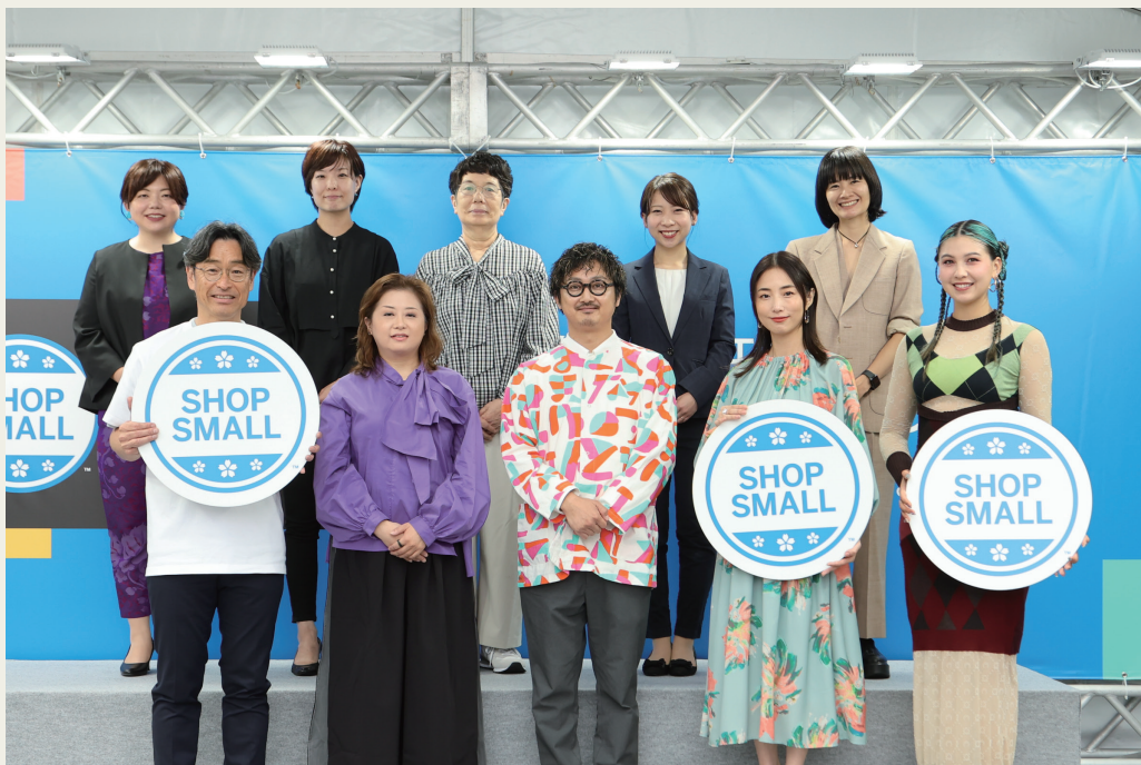
9月23日に恵比寿ガーデンプレイスで行われた「RISE with SHOP SMALL 2023」授賞式の様子

Geniusのアーティストが描くアート作品をプロデュースするものづくりブランド「fa」が、アメリカン・エクスプレスが中小店舗支援の取り組みとしてシヨップオーナーの様々な挑戦を応援する、「RISE with SHOP SMALL 2023」（ライズ・ウィズ・シヨップスモール 2023）で最高賞を受賞いたしました。