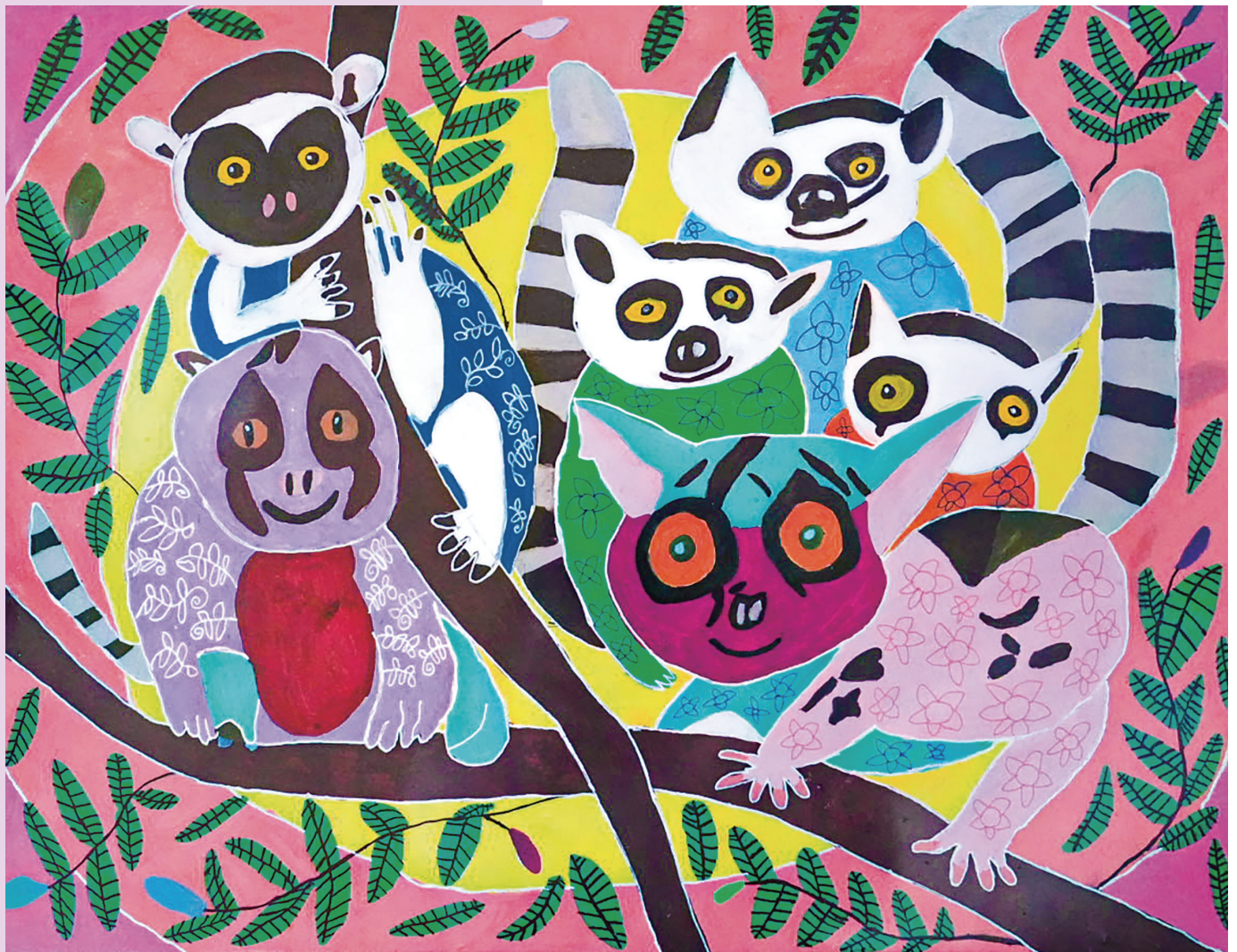
みんなファミリー